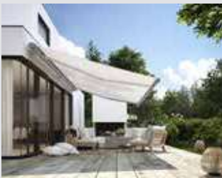
Markisen und Textiler Sonnenschutz