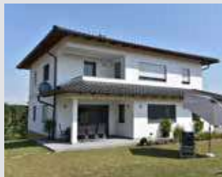
Ziegel-Rollladenkästen mit Sonnenschutz