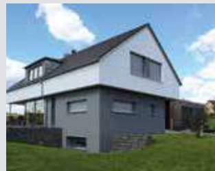
Vorbau und Unterputzkästen mit Rollläden oder Raffstore